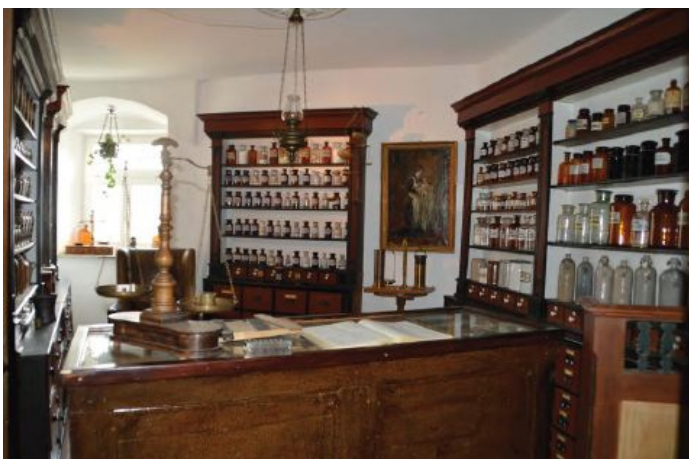
Die historische Einrichtung der St. Georgs-Apotheke hat einen eigenen Raum im Burgmuseum bekommen.

Wer kennt noch die alte, gute Apotheke mit dem mystischen Lichte der geheimnisvollen Dämmerung und den dazugehörigen Gerüchen nach ausländischen, überirdischen Düften. Wer sieht noch die alten Gefäße und vielen Flaschen mit dem für uns undefinierbaren, aber scheinbar zauberhaften Inhalt. Wer wartet noch auf seine Arznei geduldig in dem Halbdunkel einer Sitzecke auf der alten Truhe, auf die Geräusche horchend beim Fertigen der Pillen in der sonst so stillen Offizin.