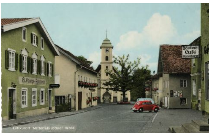
Die „alte“ St. Georgs-Apotheke in der unteren Burgstraße