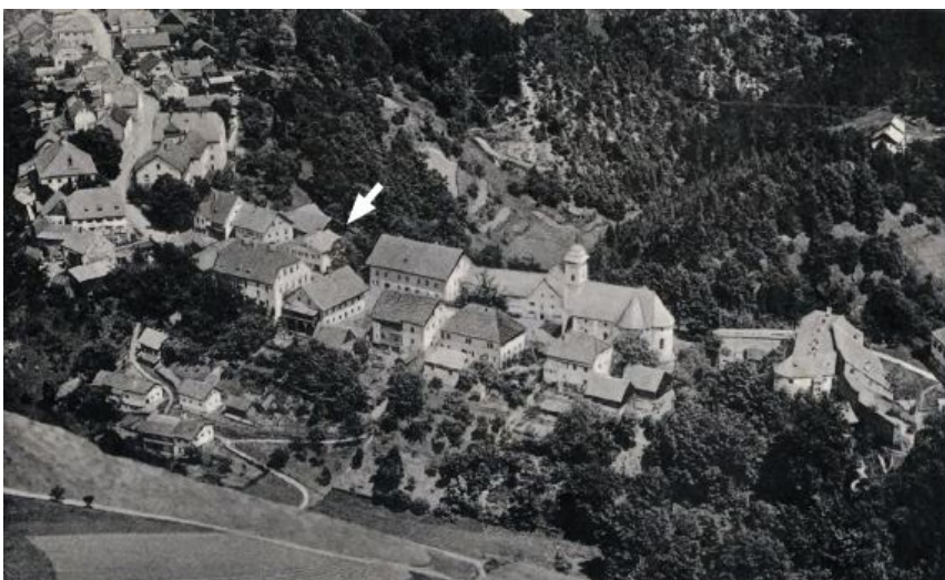
Luftaufnahme von Mitterfels,1941. Die St. Georgs-Apotheke ist mit einem Pfeil gekennzeichnet.