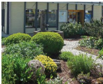
Ein Blickpunkt an der Einmündung der Burgstraße in die Straubinger Straße ist der Apothekergarten.