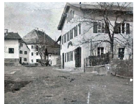
St. Georgs-Apotheke im Jahre 1907 - ein nicht coloriertes, nicht geschöntes Foto der Mitterfeler Hauptstraße