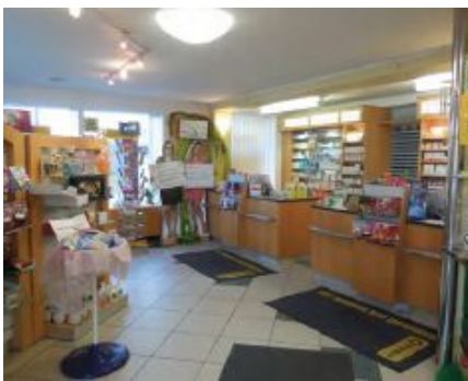
Einrichtung der Apotheke heute

Es gibt aber auch heute noch traditionelle Dinge, die eine Apotheke regelmäßig durchführt: viele besondere Salbenmischungen, spezielle Zäpfchen und Kapseln sowie Teemischungen werden durch die Mitarbeiter in der Apotheke individuell hergestellt. So bleibt noch ein wenig traditionelles Flair mit dem besonderen Geruch einer ursprünglichen Apotheke erhalten.