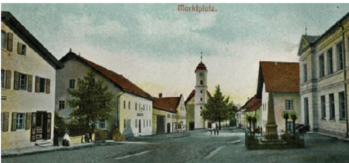
Auf einer Postkarte von 1903, die die frühere Hauptstraße (jetzige Burgstraße) und die damalige Pfarrkirche St. Georg zeigt, ist die St. Georgs-Apotheke ganz links zu erkennen. 125 Jahre war die Apotheke hier untergebracht, auch eine Jubiläumszahl.

„Jedem Landgerichtsbezirk eine Apotheke“ - so beschloss es die Generallandesdirektion im jungen Königreich, als man sich genötigt sah, die nach der Klosteraufhebung 1803 freigewordenen Klosterapotheken neu zu verteilen. Es bestand ein echter Bedarf, denn das runde Dutzend selbständiger Apotheken in Niederbayern konzentrierte sich auf nur wenige Städte. Auf dem flachen Lande verfügten Landärzte und